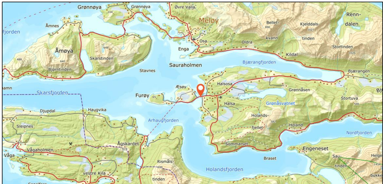
Figur 1. Planområdets beliggenhet.

Planområdet ligger i Halsasentrum i Meløy kommune og omfatter gnr. 26, bnr. 170 med flere. Området omfatter blant annet lokaliseringen av Halsasentrum AS med byggtorget butikk m.m. og Sentrumsbygget med helserelevante tjenester, lokaler for Halsasentrum husflidslag, garnbutikk, pub/spisested m.m.