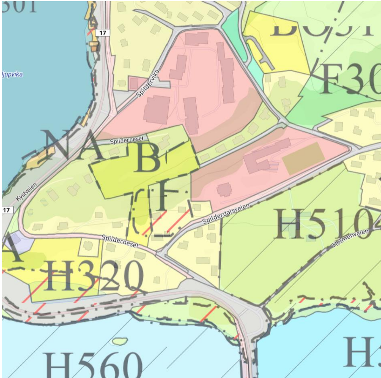
Figur 2. Utsnitt fra kommunedelplan for Ørnes 2013-2025. www.kommunekart.no

omfattes en mindre del av planområdet av en hensynssone for ras- og skredfare (rød skravur). Bestemmelser og retningslinjer fra kommuneplanen vil i hovedsak videreføres i reguleringsplanen.