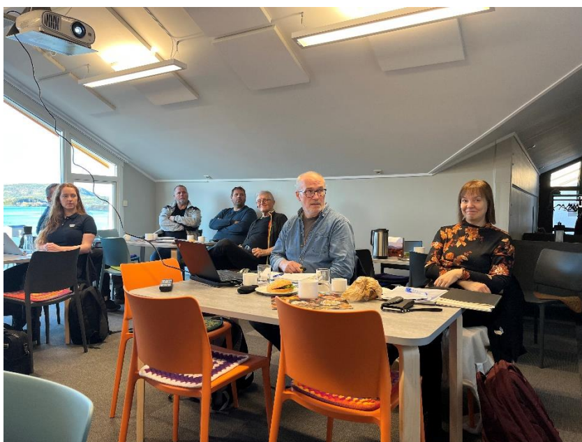
Figur 2: Medvirkningsmøte om havbruk på Frivilligsentralen i Ørnes