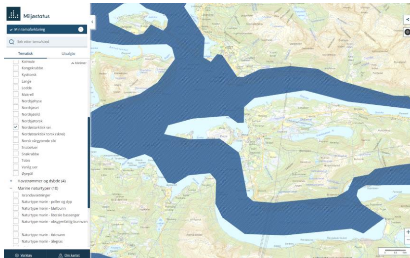
Figur 5: Eksempel på utsnitt fra Fiskeridirektoratets kartdatabase: Utbredelse av nordøst-arktisk sei i fjordsystemet rundt Skardsfjorden - Bjærangen – Holandsfjorden.