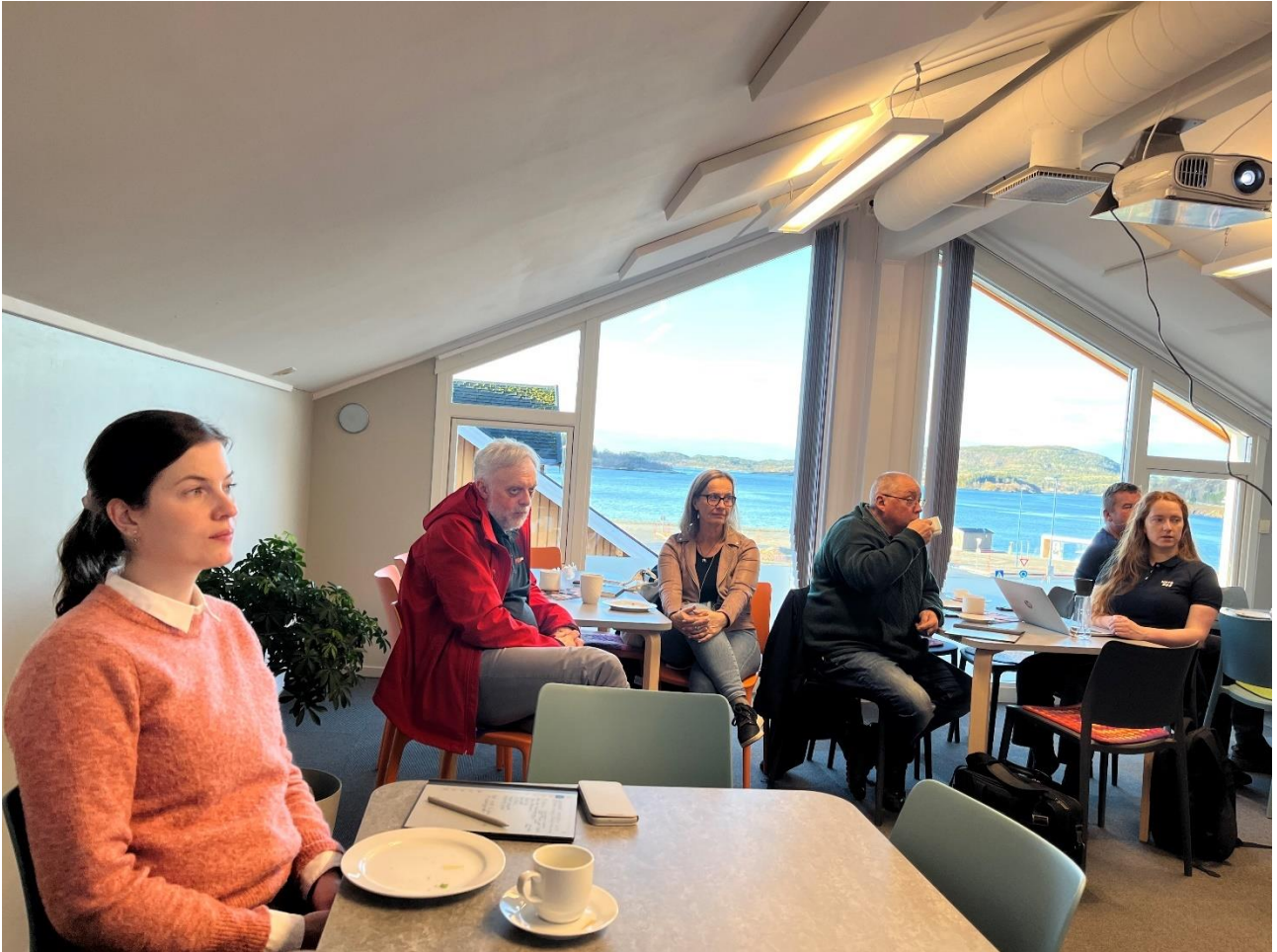
Figur 7: Medvirkningsmøte havbruk – fiskeri og akvakultur