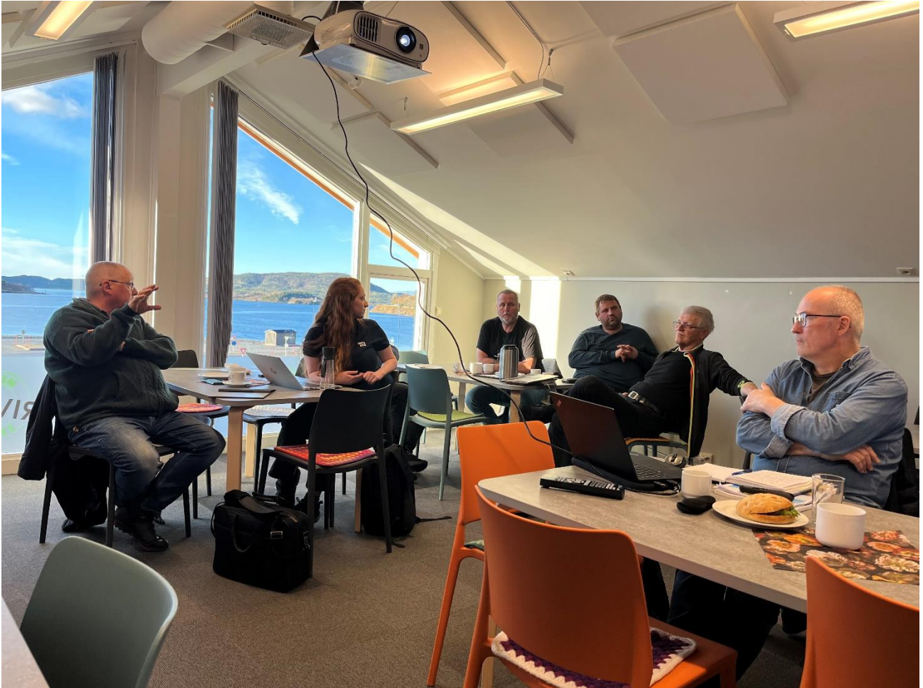
Figur 6: Diskusjon mellom de ulike havbruksnæringene