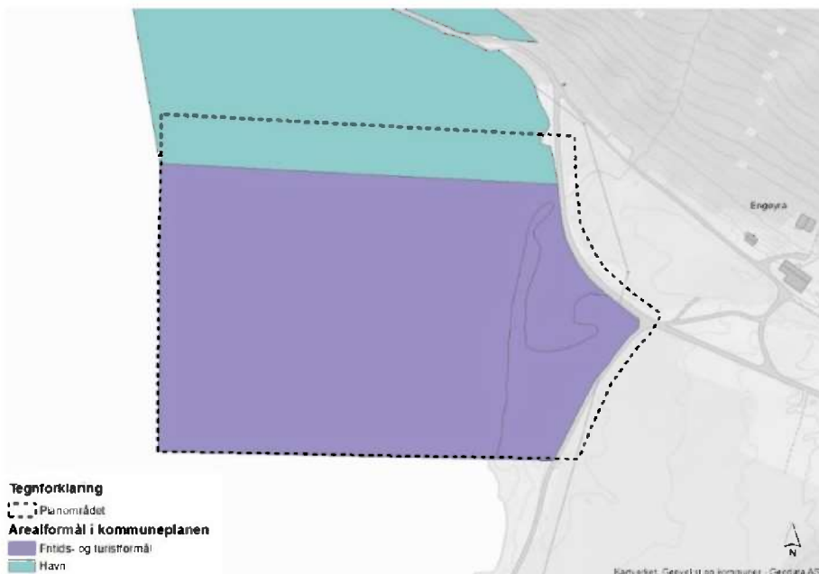
Figur 1. Kartet viser forskjellen mellom FT703 slik det er avgrenset i kommunedelplan Engenbreen og planavgrensningen for reguleringsplanen. Arealet nord for FT703 er avsatt til havn i kommunedelplanen.

Engenbreen, se figur 1. I tillegg til arealet som utgjør FT703 er det tatt med en del av arealet avsatt til havn i nord, samt at dagens grusvei i øst er inkludert. Hotellbygningen er planlagt innenfor avgrensningen av FT703, men det er tatt med noe mer areal i nord for å sikre fleksibilitet i detaljplanleggingen av bryggeanlegget tilknyttet hotellet. I utgangspunktet skal båten legge til med kort avstand fra hotellet, men den videre planleggingen vil avklare hva som er praktisk mulig å få til. Grusveien er tatt med i planområdet med tanke på mulige behov for terrengtilpasninger eller annet som berører denne. Arealet utgjør totalt 124 dekar, hvorav 24 dekar er landareal og 100 dekar er tilgrensende areal i sjø.