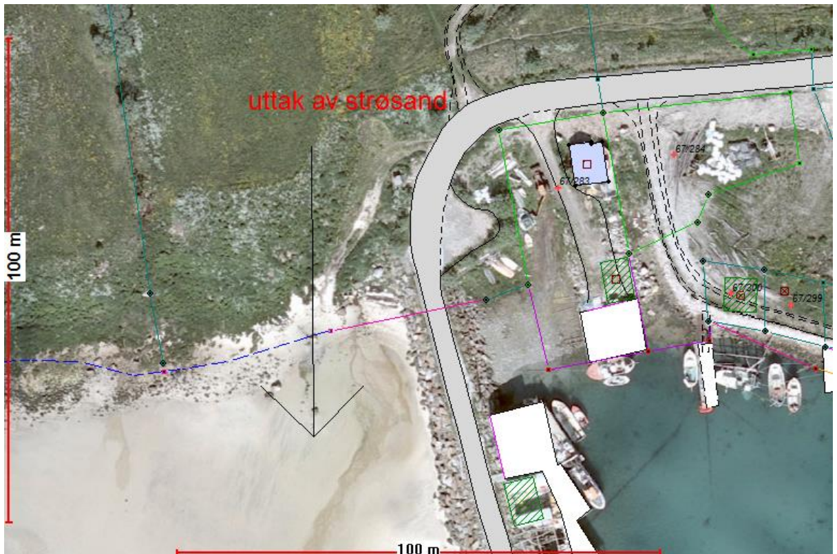
Uttak av strøsand på gnr. 67 bnr. 210

nedenfor. Det blir tinglyst egen avtale på dette uttaket som tinglyses på eiendommen gnr. 67 bnr. 210.